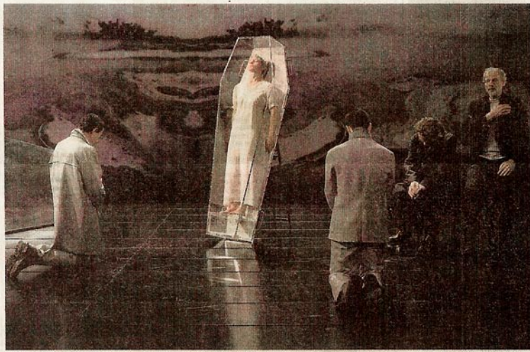
« Ordet », au Cloître des Carmes d'Avignon, confronte forme contemporaine et texte venu d'un autre monde.

La pièce met en scène une famille, organisée autour du patriarcat veuf, Mikkel Borgen, et de ses trois fils, Mikkel le jeune, Johannes et Anders. En raison