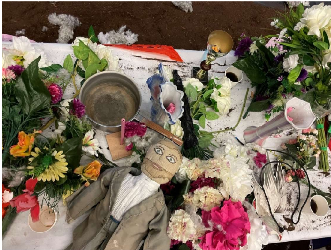
Recherches scénographiques © Louise Sari